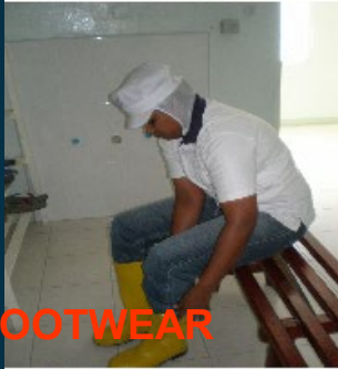
2. PUT ON FOOTWEAR